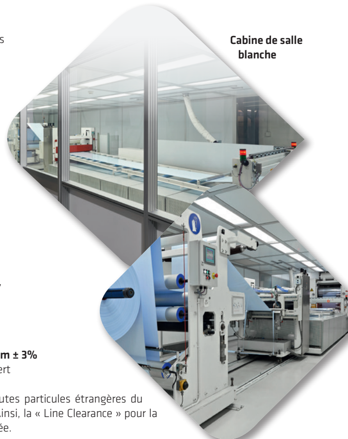
Cabine de salle blanche

Pour éviter que la bande de film ne se salisse, le procédé se déroule dans une cabine de salle blanche, sous contrôle.